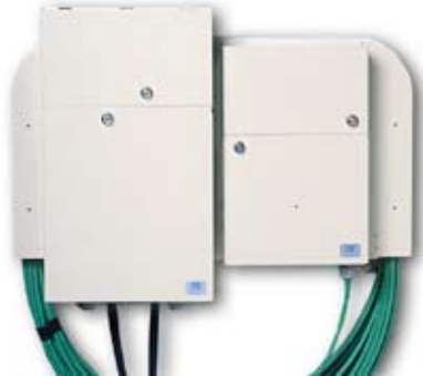
Kabelgalge 600 med 48 och 24 fibers Multiflexboxar monterade

Kabelgalge 600 har monteringshål för 2 st Multiflexboxar 24/48 fiber alternativt 1 st Telecombox 240 Skarvbox.