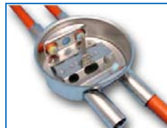
Skarvbox BLF 4 x 40