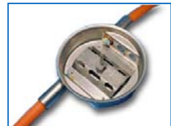
Skarvbox BLF 2 x 40 inline