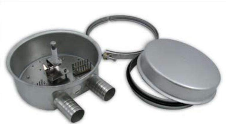
Skarvbox BLF för blåsfiber system

Skarvbox BLF ingår i ett modulsystem av låsbara kapslingar tillverkade i syrafast rostfritt stål. Kännetecknande är stor flexibilitet, enkel hantering och täthet för både tryck och vakuum.