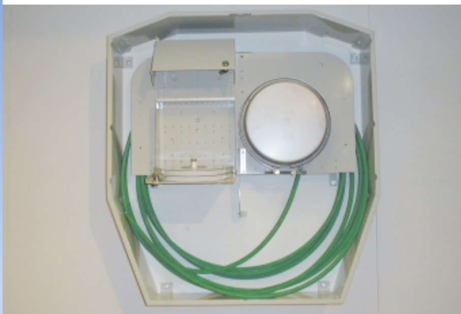
Skyddshuv 600 med Multiflex och Skarvbox monterad på Kabelgalge 600.

Skyddshuv 600 ger ett säkert skydd för fiberboxar och överskott av fiberkabel vid installationer i oskyddad miljö. In/utgående kablar och fiber förlägges i rör eller skyddas av täckplåt vid anslutning mot skyddshuv. Genomföringshålen är dammskyddade med borst. Levereras med låsvred och locket har standard hålbild för Assa-Abloy lås.